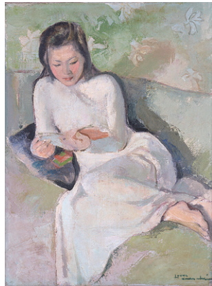
ルオン・スアン・ニー [ベトナム] 《読書する若い娘》 1940年 福岡アジア美術館所蔵 Luong Xuan Nhi [Vietnam] A Reading Girl 1940, Collection: Fukuoka Asian Art Museum