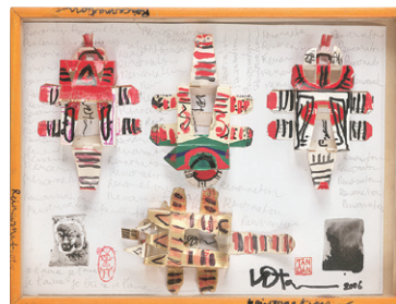
ヴー・ダン・タン [ベトナム] 《転生》 2006年 Art-U room所蔵(福岡アジア美術館寄託) Vu Dan Tan [Vietnam] Reincarnation 2006, Collection of Art-U room (Deposited in Fukuoka Asian Art Museum)

〒812-0027 福岡市博多区下川端町3-1リバレンセンタービル7・8階 Tel: 092-263-1100 Fax: 092-263-1105 https://faam.city.fukuoka.lg.jp 7-8F Riverain Center Bldg., 3-1 Shimokawabata-machi, Hakata-ku, Fukuoka, 812-0027 Japan