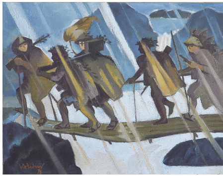
ホアン・ティック・チュ [ベトナム] 《橋をわたる部隊》 1973年 雪江なほみ氏所蔵 Hoang Tich Chu [Vietnam] Soldiers Crossing a Bridge 1973, Collection: Yukie Nahomi