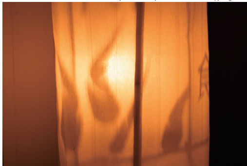
ウィリー・サイウッド[ラオス] / Willie Xaiwouth [Laos]