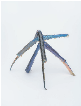
モハメド・フォズレ・ラッビ・フォティック[ Bangladesh ] / Md. Fazla Rabbi Fatiq [Bangladesh]