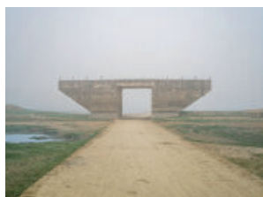
参考作品 / reference 《Mirage》2023年 Mirage, 2023