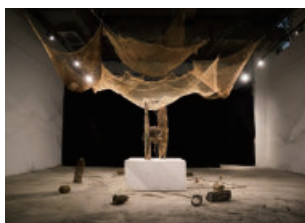
参考作品 / reference 《Fade》2023年 Fade, 2023