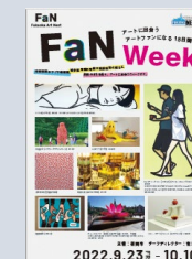
【FaN Week 連携企画】