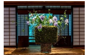
2022 -THE FLOWER BOX EXHIBITION IN DAZAIFU より

19 歳でデンマークより単身来日し、その才能を開花させたフラワーアーティスト。北欧のテイストと日本の感性を融合させた独自のスタイルで、自身が考案した「フラワーボックス」がフラワーギフトの定番として人気を博す。現在、ファッション界、デザイン界にも活躍の場を広げ、日本を拠点にソウル、デンマークと事業を展開中。2021 年には箱根・強羅の地に ニコライ バークマン 箱根 ガーデنزをオープンし、フラワーデザインの枠をこえ、更なる活躍の場を広げている。