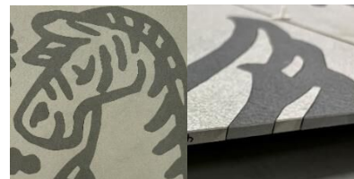
作品イメージ(一部)