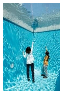
Swimming Pool

アルゼンチンの首都ブエノスアイレス生まれの芸術家、現代美術家。人間がどのように事象を捉え、空間と関わり、現実を把握していくかを追求する作品を多数発表している。作品の多くは建物の一部などの立体的な造形で、錯覚の利用や、鑑賞する行為自体が作品の一部になる体験型となっている。