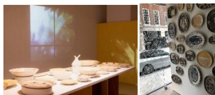
左)鹿兒島睦 まいにち展/福岡県立美術館 右)MESSUMS LONDON

福岡生まれ。造形作家だった祖父の影響を受け、沖縄県立芸術大学で陶芸科を専攻。卒業後は福岡ビル内のインテリアショップ「NIC(ニック)」で勤務したのち、陶芸家として独立。現在は福岡市内のアトリエで、陶器、ファブリックや版画など、多岐にわたり制作活動を行う。日本国内にとどまらず、L.A.、ロンドン、台北など海外でも個展を開催し、人気を博している。