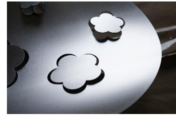
作品イメージ(一部)

天神交差点のランドマークとなる、約 12m×約 8mの大規模な壁面緑化とアートのコラボレーション作品。福岡や天神にゆかりのある梅の花を、大小さまざまなステンレスでモダンに表現します。